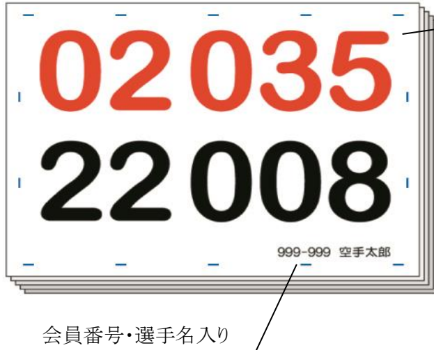
会員番号・選手名入り

兵庫県空手道連盟主催競技大会にて、大会用ゼッケンの斡旋販売を致します。 ゼッケン番号・会員番号・選手名・指定の縫い目の場所を印刷してお届けします。 なお、この斡旋販売は、任意です。別途ゼッケン制作方法に従い各自でお作り頂くことを基本としています。 形・組手の2競技用