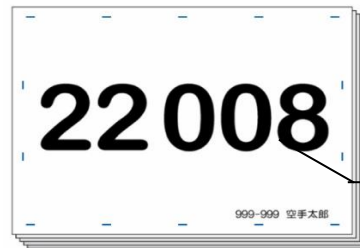
形又は組手の1競技用